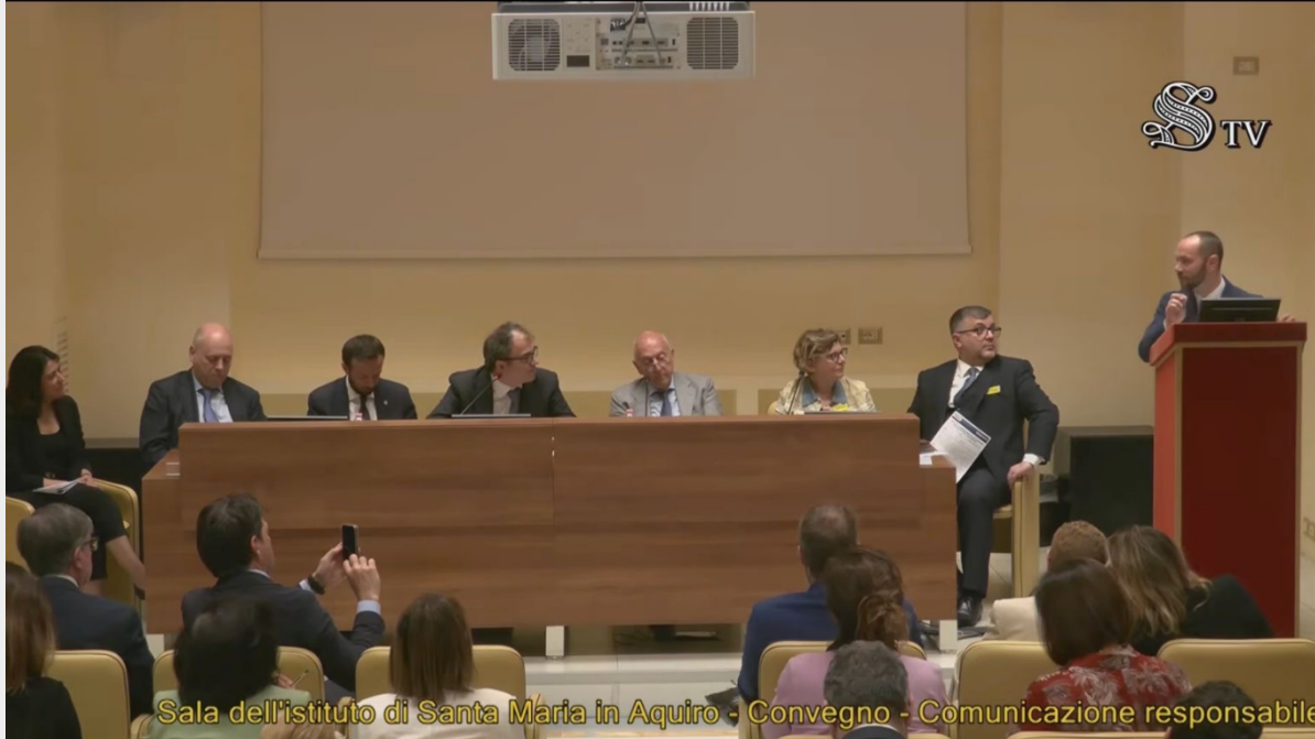
Sala dell'Istituto di Santa Maria in Aquiro - Convegno - Comunicazione responsabile

Grande partecipazione al Senato della Repubblica per la presentazione del Manifesto del Gruppo “Scienze della Vita” di FERPI , promosso su iniziativa della Senatrice Daniela Sbröllini e realizzato in collaborazione con FERPI nella sala dell'Istituto di Santa Maria in Aquiro.